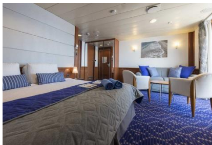
SB - SUITES CON BALCÓN

SJ – Suites Junior en la cubierta 7-Apolo (~22 metros cuadrados), tiene capacidad hasta para 3 personas, con 2 camas bajas, 1 sofacama, baño con bañera o ducha, aire acondicionado, teléfono, secador de pelo, caja fuerte, TV, refrigerador, mini bar y una ventana