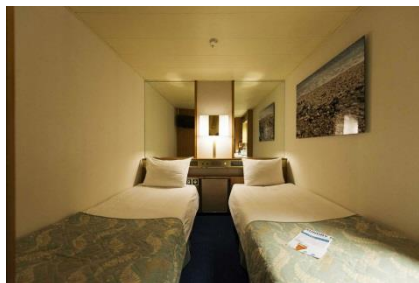
IA - CABINAS INTERIORES

IB - Cabinas interiores en la cubierta 2-Atenea y la cubierta 3-Hermes (~11 metros cuadrados), tiene capacidad hasta para 4 personas, con 2 camas bajas, 3ª/4ª literas, baño con ducha, aire acondicionado, teléfono, secador de pelo, caja fuerte y TV.