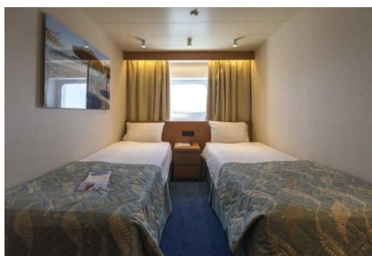
XB - CABINAS EXTERIORES

XB – Cabinas exteriores en la cubierta 2-Atenea y la cubierta 3-Hermes (~11 metros cuadrados), tiene capacidad hasta para 4 personas, con 2 camas bajas, 3ª/4ª literas, baño con ducha, aire acondicionado, teléfono, secador de pelo, caja fuerte, TV y una portilla