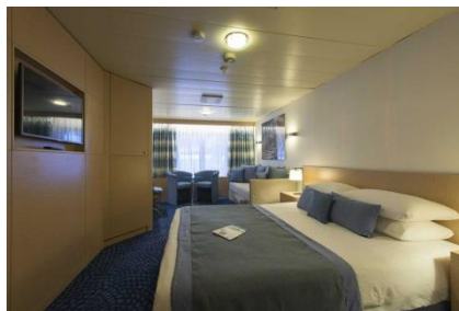
SJ - SUITES JUNIOR

SJ – Suites Junior en la cubierta 7-Apolo (~22 metros cuadrados), tiene capacidad hasta para 3 personas, con 2 camas bajas, 1 sofacama, baño con bañera o ducha, aire acondicionado, teléfono, secador de pelo, caja fuerte, TV, refrigerador, mini bar y una ventana