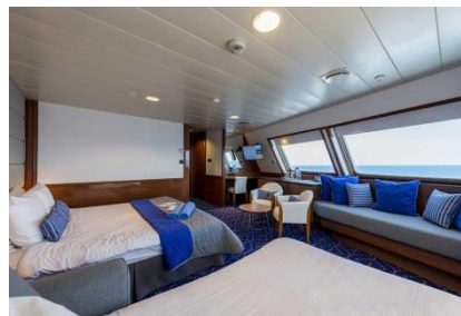
SG - GRANDES SUITES

SB – Suites con balcón en la cubierta 9-Hera (~27 metros cuadrados) tiene capacidad hasta para 3 personas, con 1 cama de matrimonio, 1 sofacama, baño con bañera, aire acondicionado, teléfono, secador de pelo, caja fuerte, TV, refrigerador, mini bar y un balcón.