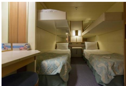
IB - CABINAS INTERIORES

IB - Cabinas interiores en la cubierta 2-Atenea y la cubierta 3-Hermes (~11 metros cuadrados), tiene capacidad hasta para 4 personas, con 2 camas bajas, 3ª/4ª literas, baño con ducha, aire acondicionado, teléfono, secador de pelo, caja fuerte y TV.