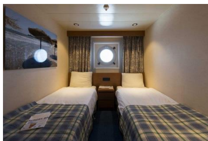
XA - CABINAS EXTERIORES

XB – Cabinas exteriores en la cubierta 2-Atenea y la cubierta 3-Hermes (~11 metros cuadrados), tiene capacidad hasta para 4 personas, con 2 camas bajas, 3ª/4ª literas, baño con ducha, aire acondicionado, teléfono, secador de pelo, caja fuerte, TV y una portilla