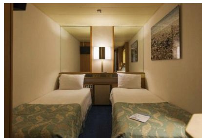
IC - CABINAS INTERIORES

ID - Cabinas interiores en la cubierta 3-Hermes y la cubierta 4-Poseidón (~11 metros cuadrados), tiene capacidad hasta para 4 personas, con 2 camas bajas, 3ª/4ª literas, baño con ducha, aire acondicionado, teléfono, secador de pelo, caja fuerte y TV.